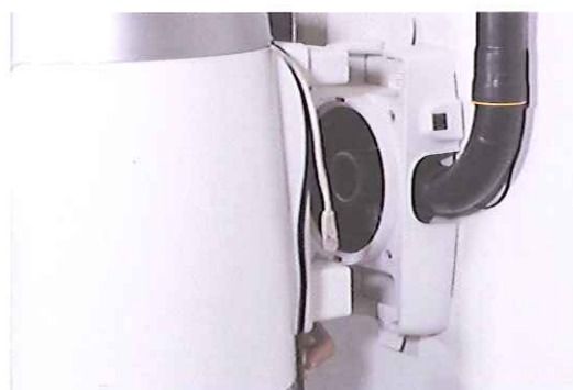
Nytt intelligent väggstativ med click-fästen för centralenheten

Planeringens fokus på detaljer syns till exempel i hur enkelt det är att tömma dammbehållaren. De lättillgängliga handtagen och behållaren som fästs i 360°-läge gör tömningen till en enkel process. (Modeller i Z-serien)