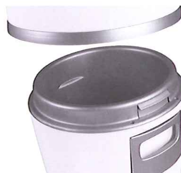
Stor och rymlig dammbehållare med snabbfäste